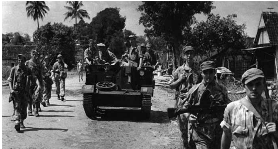
Militairen op patrouille