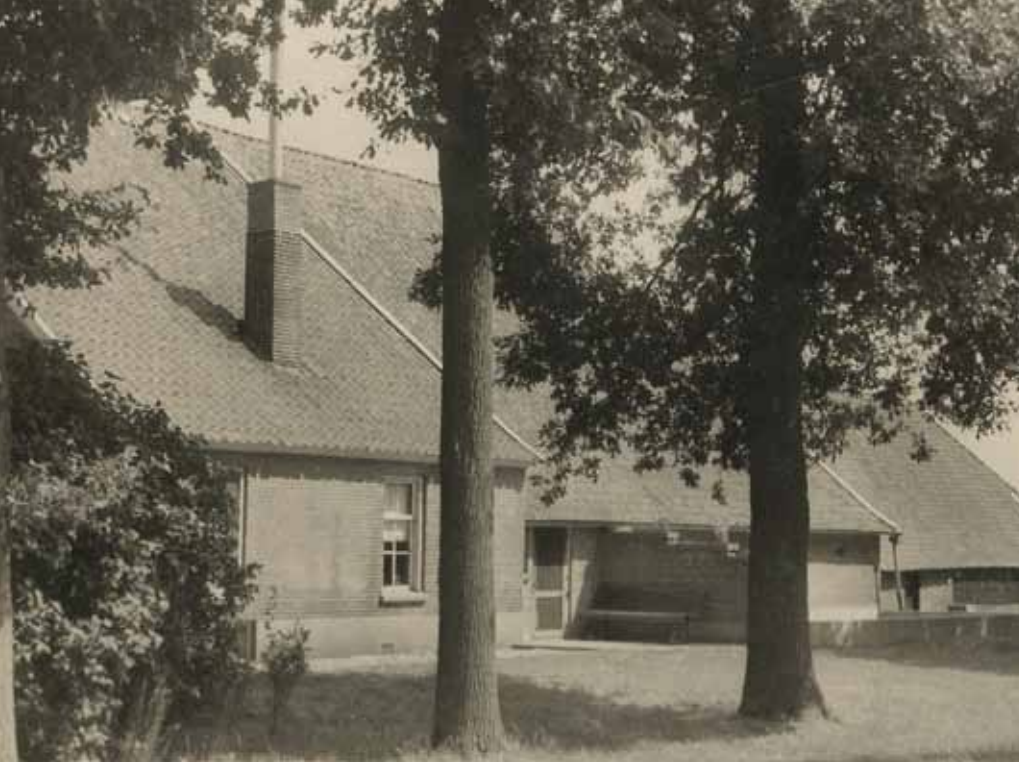
Boerderij Hogestege aan de Nettelhorsterweg, destijds met huisnummer I 6

districtsleider aan dit instituut zou afronden. Later tijdens de jaren van zijn pensioen kon hij zich met overgave wijden aan een andere passie: de geologie. Zijn grote verzameling stenen vond eerst een onderkomen in zijn eigen museum in een tuinhuisje, De Geo-Inn. Gerrit Jan overleed op 9 maart 2007 op bijna 90-jarige leeftijd. Zijn geologische verzameling is nu te bezichtigen in het Geologisch Museum te Velp.