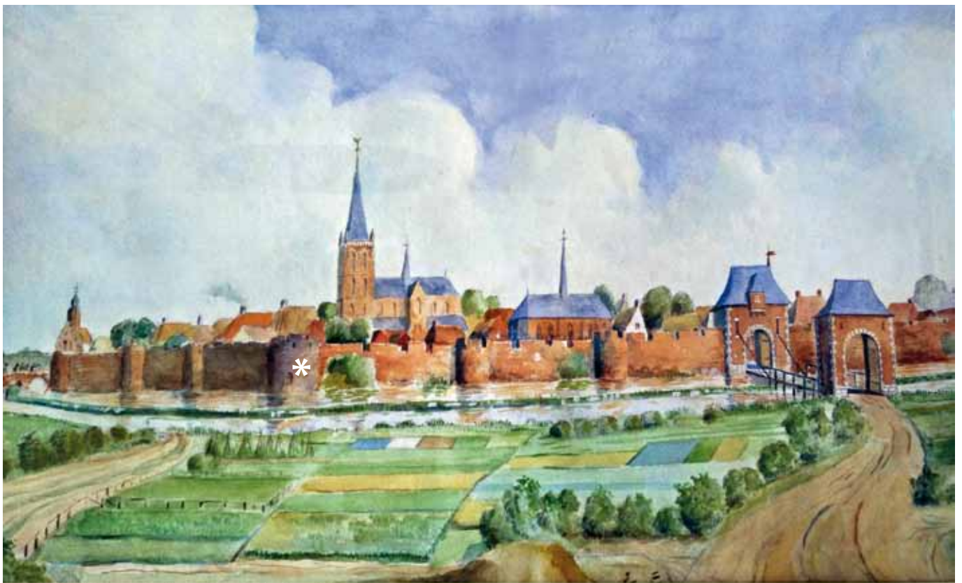
Deze tekening laat zien hoe Lochem er uitzag in de lente van 1582.

Ook enkele nieuwe details over de verdere geschiedenis van dit markante gebouw en zijn bewoners zijn boven water gekomen.