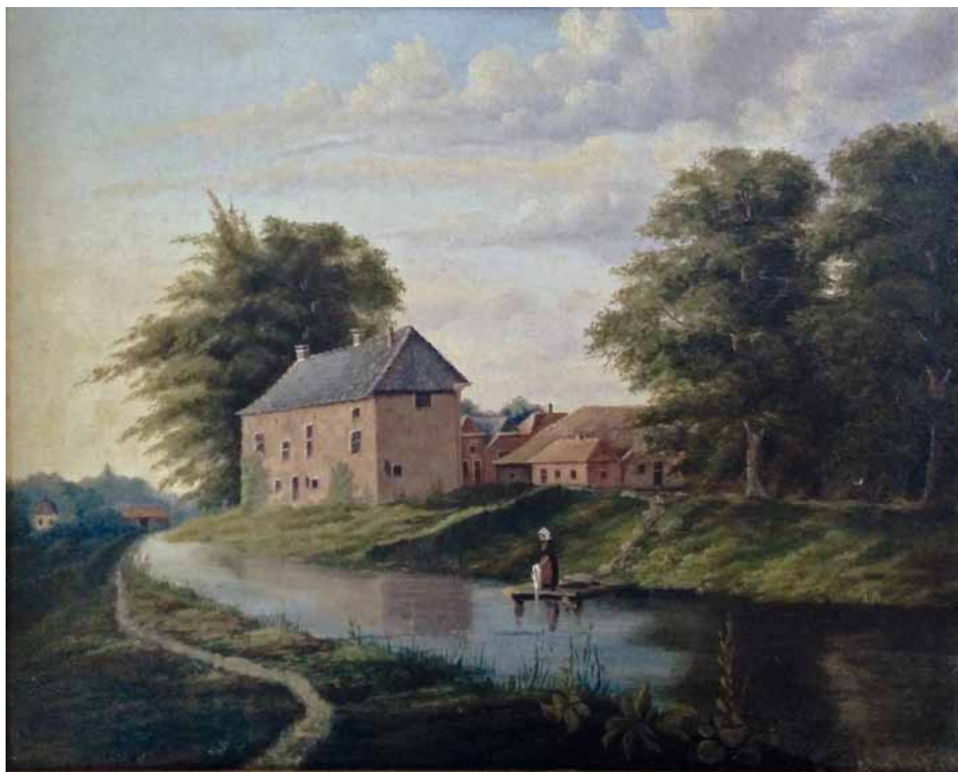
Schilderij van de Blauwe Toren, gemaakt in 1864 door Gradus ten Pas.

Historisch Genootschap Lochem Laren Barchem en familie Van Beek.