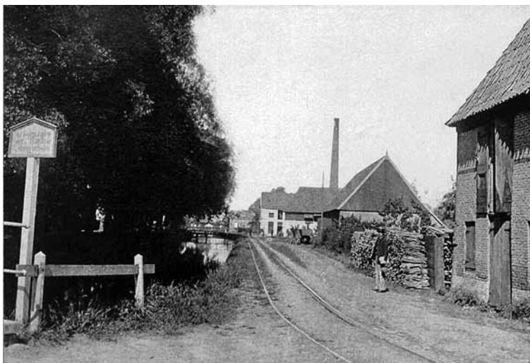
Ansichtkaart Noorderbleek ca 1900