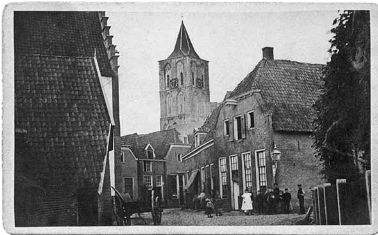
De Bierstraat in 1865 – Linksboven de trapgevel van nr. 34.

'Bierstraat 34 behoorde van oudsher tot de aanzienlijkste huizen van de stad. Dit valt behalve aan de omvang en de rijkdom van het object zelf af te leiden uit een foto van circa 1865 waarop het huis nog staat afgebeeld met een hoge 17 e eeuwse trapgevel, een zeer zeldzaam verschijnsel in Lochem. Bovendien telde het pand als één van de weinige huizen in de Lochemse binnenstad twee volledige van baksteen opgetrokken bouwlagen en een zolderverdieping. Tegenwoordig is de vroegere betekenis van het huis nog afleesbaar aan de rijk geornamenteerde muurankers in de voorgevel, van een type dat in Lochem alleen in de gevels van het stad- en raadshuis kan worden aangetroffen. Deze ankers dateren uit de eerste helft van de 17 e eeuw'.