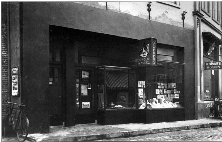
Voorraanzicht winkel van boekhandel Schepers