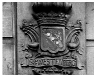
De wapens op het oude stadhuis