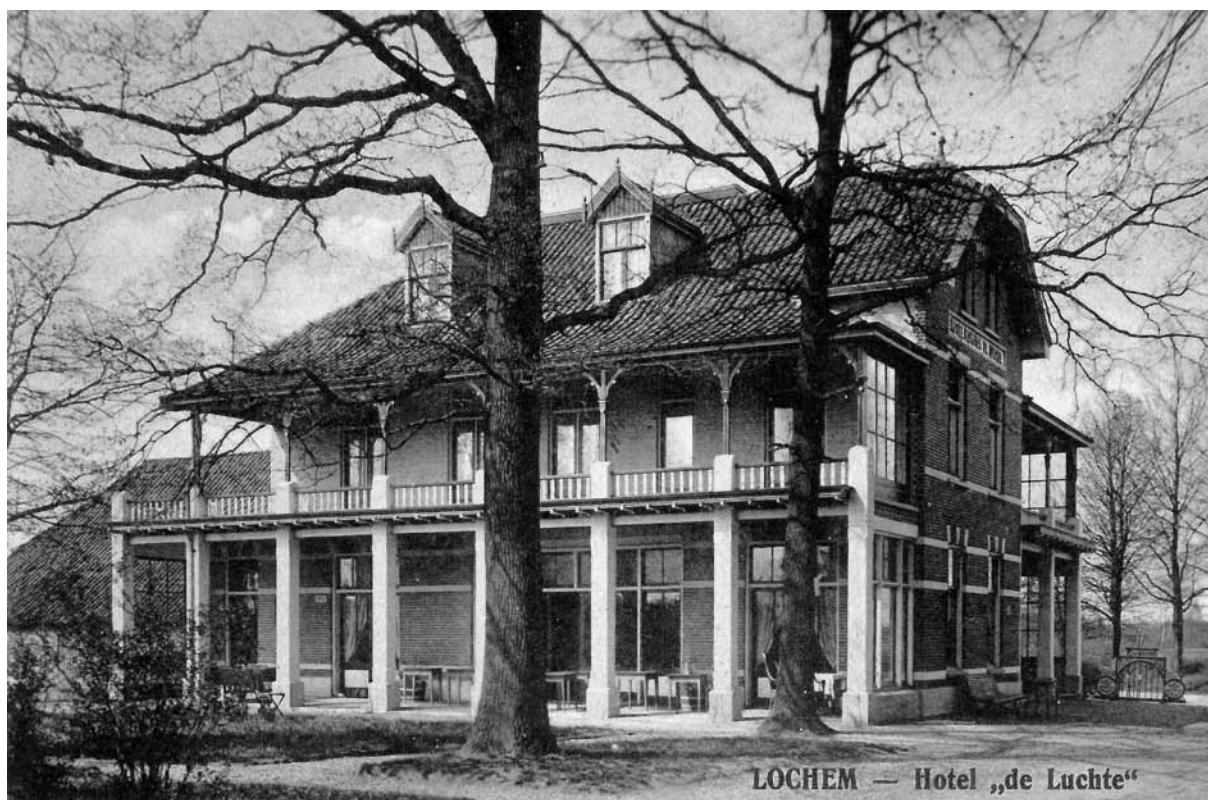
"De Luchte" aan de Zutphenseweg, rond 1900.

Aan dezelfde eigenaar behoort het hôtel De Luchte aan den weg naar Zutphen, nog gloednieuw en bekoorlijk gelegen te midden van hooge beuken. Telkens uitgebreid wegens het drukke bezoek is ook "Het Wapen van Ampsen", dicht bij het station en aan de ingang der prachtige bosschen om den "Huizen Ampsen". Als men daarbij weet, dat het stadje van nauwelijks 4000 inwoners behalve op eenige ruime "pensions" nog kan bogen op twee hôtels van den eersten rang, terwijl ook dikwijls bij kleine burgers, kamers worden gehuurd, dan kan men zich eenigszins een denkbeeld vormen van het vreemdelingenverkeer in de omstreken van Lochem gedurende het schoone jaargetijde.