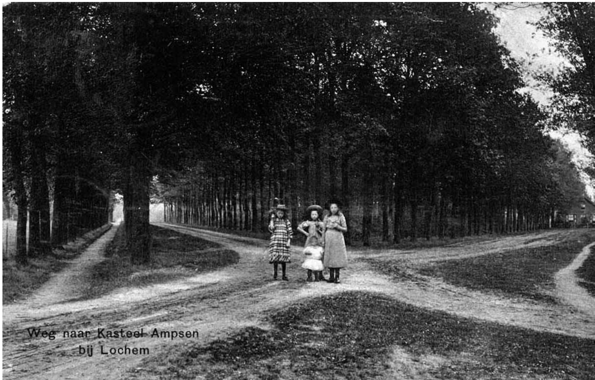
Weg naar Kasteel Ampsen bij Lochem

Eenzaam is het om u heen; maar alleen zijt ge toch niet. Hier slaat een vink op den eiketak, daar vliegt een tortelduif over het bosch, ginds fladdert een specht schreeuwend van boom tot boom of klimt een eekhoorn haastig naar den top. De natuur - eeuwig jong en schoon - omringt u aan alle zijden.