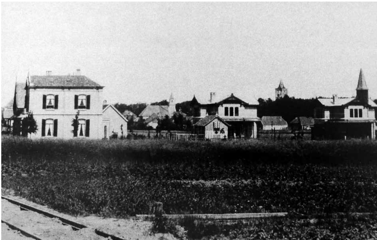
De eerste villa's aan de Nieuweweg, gezien vanuit het oosten.