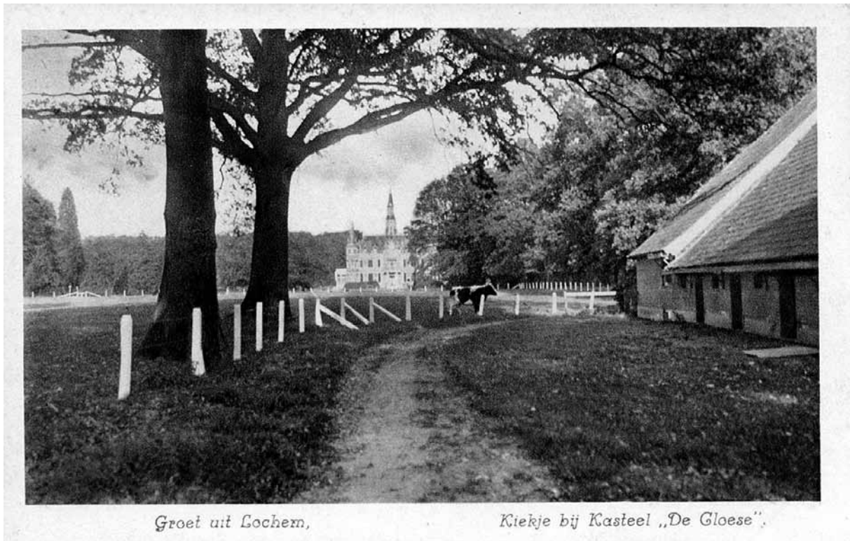
Groet uit Lochem,