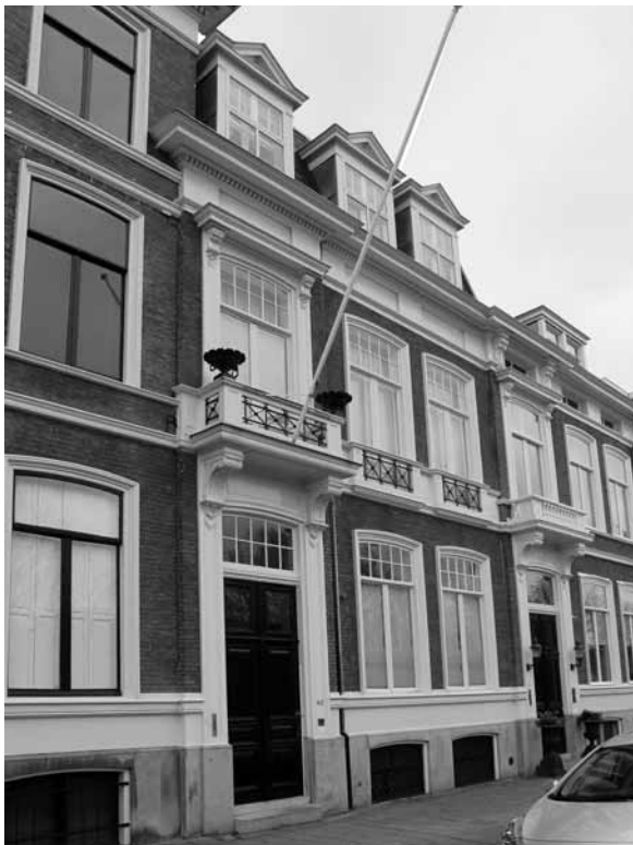
Het herenhuis van de familie Roëll-Van Wickevoort Crommelin aan de Koninginnegracht in Den Haag.