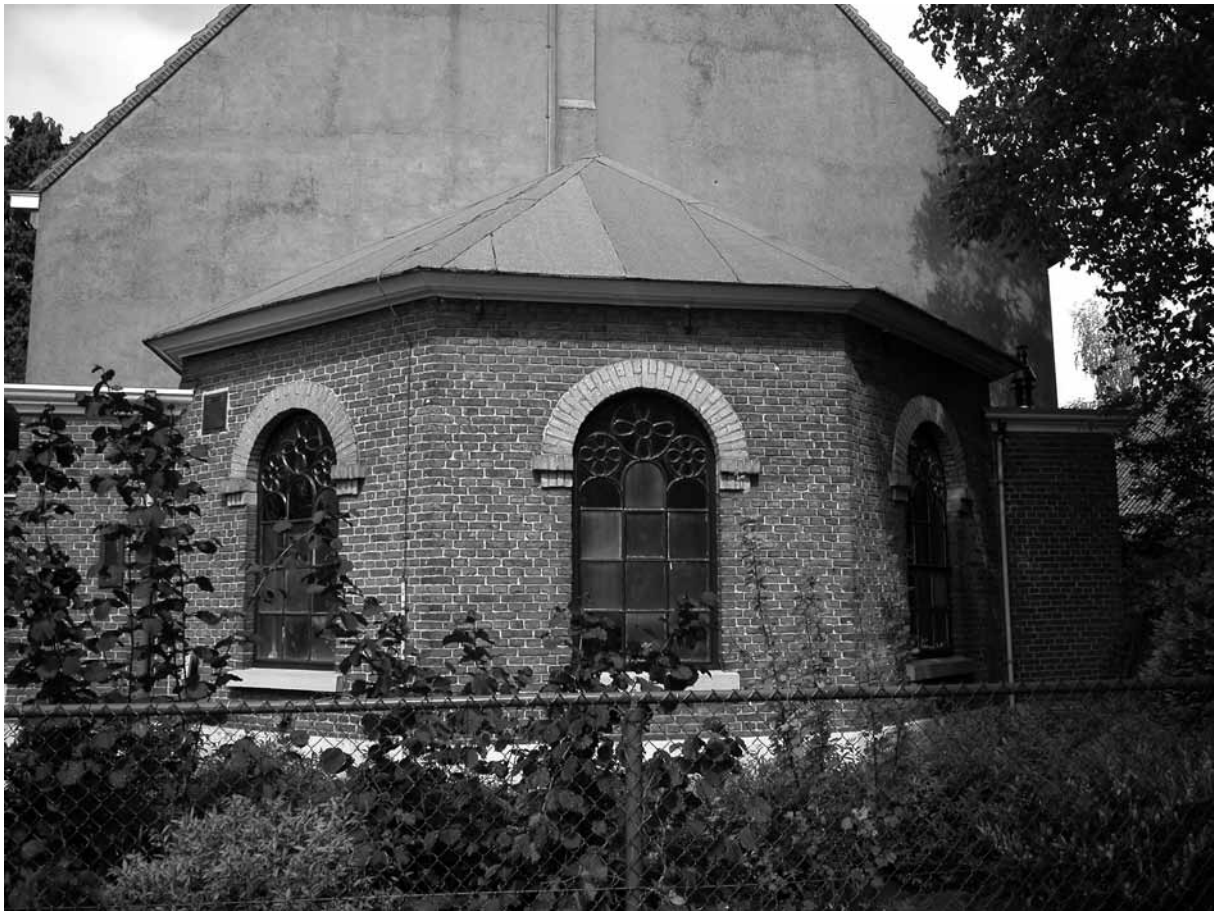
Het catechisatielokaal uit 1879 tegen de achtergevel. Karakteristiek zijn de rondbogen van gele bakstenen boven de gietijzeren ramen.

hij in en rond Lochem enkele villa's en in 1887 de nieuwe rooms-katholieke kerk aan de Nieuweweg. De aanbesteding van de Remonstrantse kerk vond plaats op 27 maart 1879. De gebroeders L. en A.J. Reerink en Zn. te Lochem namen het werk aan. Op 1 oktober 1879 werd de kerk opgeleverd en op 13 november vond de eerste bestuursvergadering in de consistoriekamer plaats. De orgelbouwer Leichel uit Düsseldorf leverde een orgel.