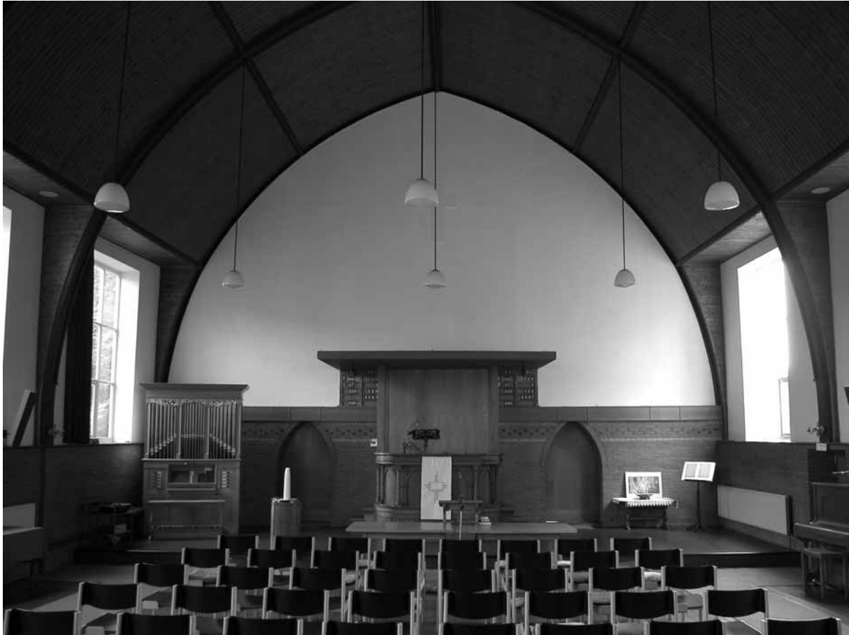
Het interieur van de kerk