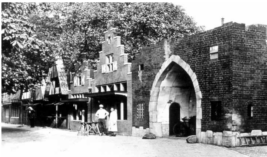
Decor Grote Markt, 1933

En het ging verder hoe bij de Smeepoort bij het hooipakken voor geit en konijn aan een Spaanse laars getrokken werd. Op de wal tegenover Sporthuis Bosman en kleermaker Aartsen stond met oranje Afrikaantjes in het groene gras: 1233 - 1933. Er waren twee optochten, een historische met o.a. Graaf Otto, en een allegorische waarin alle buurten een wagen hadden, passend bij hun buurt; wij van de Kastanjelaan hadden op een wagen het verkooplokaal van Nijstad en Hamer. Er was een afslager en wij kinderen waren de kopers. De beide grote optochten werden voorafgegaan door de Lochemse Erewacht. Een ruitergroep gekleed in zwarte colberts, witte rijbroek, zwarte laarzen, (ik dacht)