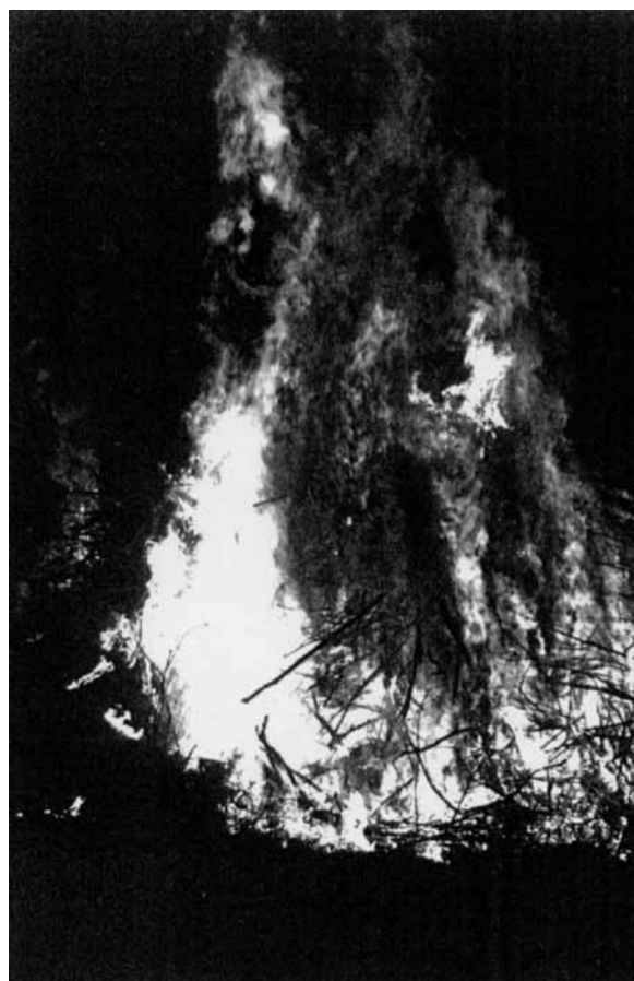
Paasvuur in Klein Dochteren, 2009.