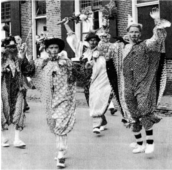
Speelse bielemannen in Bronkhorst, 1965.